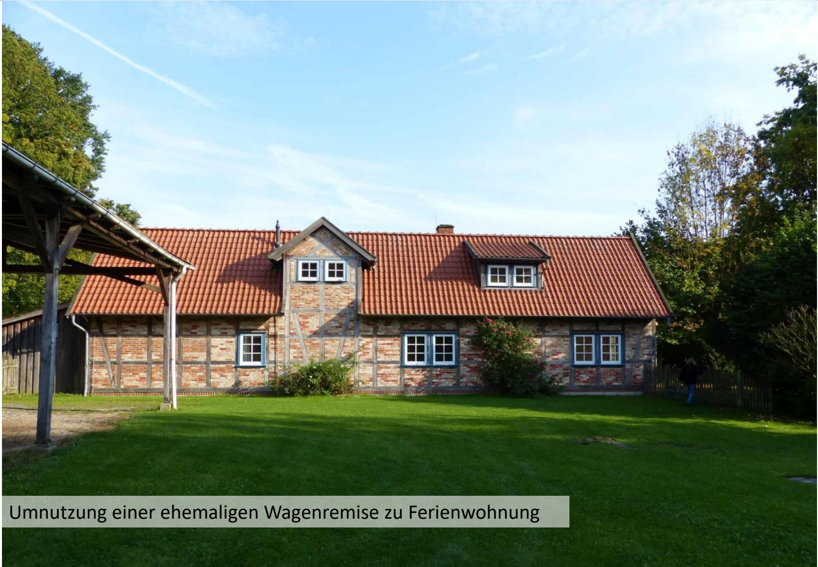
Umnutzung einer ehemaligen Wagenremise zu Ferienwohnung

Fördermöglichkeiten für die Innensanierung einschließlich Gestaltung der Außenhülle